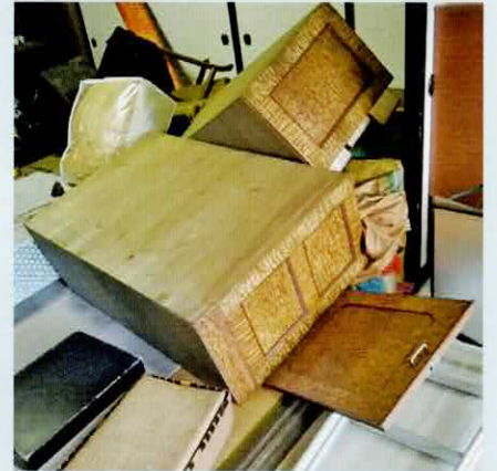
参考：平成30年北海道胆振東部地震による室内の被害状況