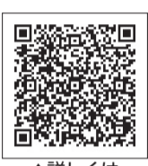
▲詳しくはこちらから

※抽選▶申込=A 6月24日 B 7月22日(いずれも必着)まで、往復はがき・電子申請(区ホームページ参照)で、郷土資料館(〒175-0092赤塚5-35-25)※申込記入例(8面)参照