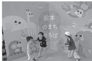
「絵本のまち板橋」の取組

ほかにも「さわる絵本」の普及や、絵本のプレゼント事業などで創造都市の取組や「絵本のまち板橋」をさらに推進していきます。ぜひ多くの方々に絵本を通じた様々な体験や交流を楽しんでいただけたら幸いです。