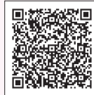
▲詳しくはこちらから

みなさんの住まいの防犯対策を一層進めていただくため、侵入窃盗による被害防止のための防犯機器の購入・設置費用の一部を補助します。