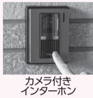
カメラ付きインターホン