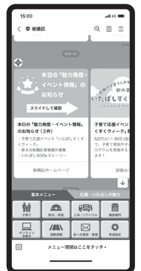
スマートフォン画面イメージ