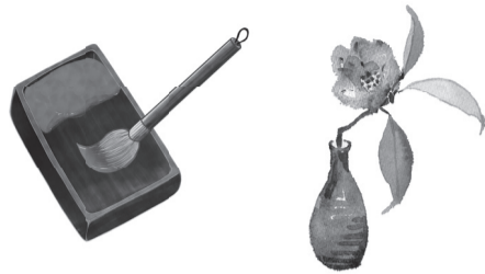
表1 かくしゃく講座

※申込記入例(6面)の項目と希望教室・施設名(徳丸ふれあい館の茶道はAまたはB)を明記