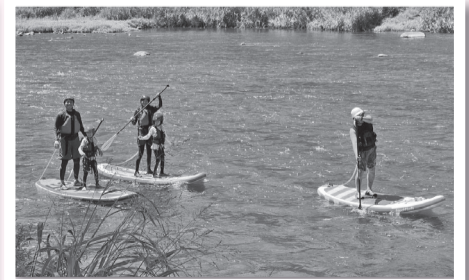
カヤック・サップ体験