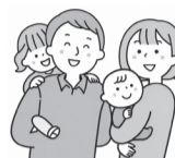
表1 児童扶養手当改定額

▶ 問 =障がいサービス課障がい相談係 ☎3579-2362 ☎3579-2364