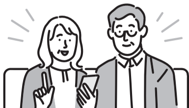
表 シニアのスマートフォン個別相談会