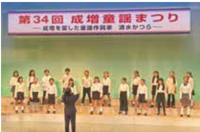
成増童謡まつり (成増)