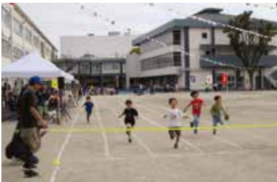
舟渡地区大運動会 (舟渡)