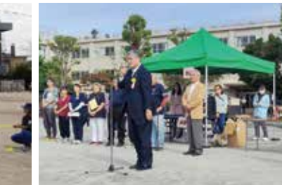
中台地区スポーツデー (中台)