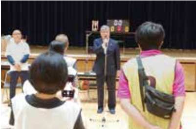
常盤台地区スポーツフェア (常盤台)