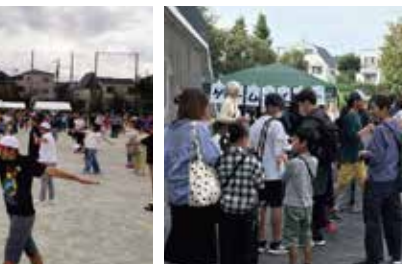
前野歩け歩けスタンプラリー (前野)