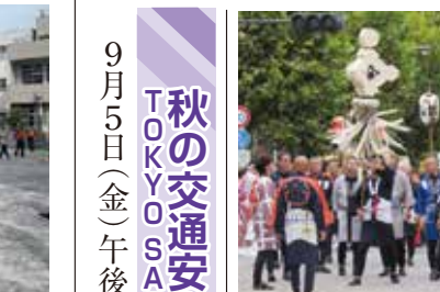
木やりと15基のみこし