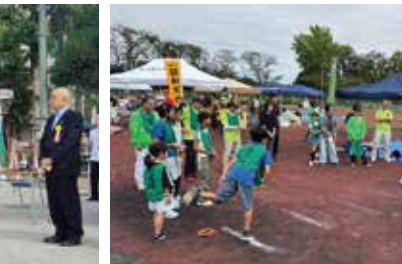
志村坂上地区スポーツ大会 (志村坂上)