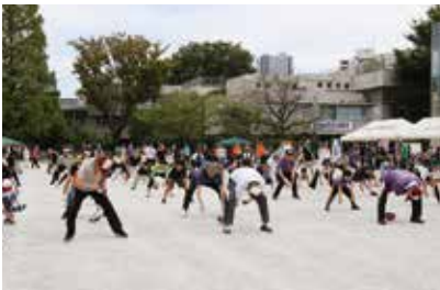
板橋地区区民大運動会 (板橋)