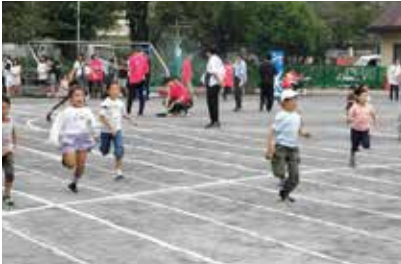
桜川地区大運動会 (桜川)

10月5日（日）は熊野・常盤台・桜川地区で、11日（土）は清水地区で、12日（日）は板橋・仲宿・志村坂上・中台・舟渡・前野地区で、13日（月・祝）は仲町