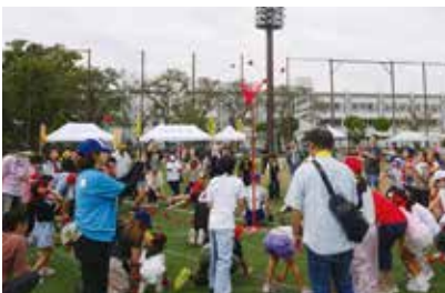
蓮根地区区民大運動会 (蓮根)