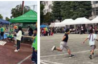
仲宿地区区民大運動会 (仲宿)