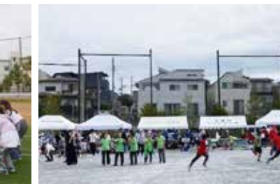
大谷口地区区民大運動会 (大谷口)