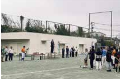
熊野地区親睦スポーツ大会 (熊野)