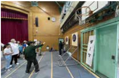
清水スポーツフェア (清水)