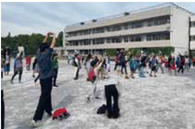
下赤塚地区ウォークラリー (下赤塚)