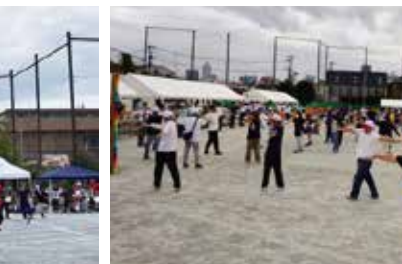
仲町地区区民大運動会 (仲町)