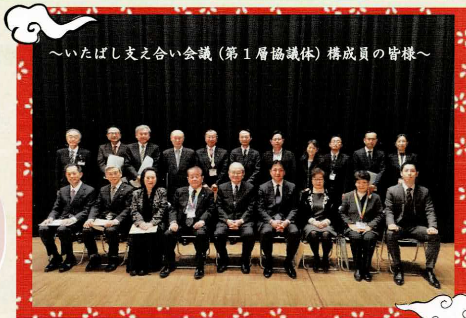
～いたばし支え合い会議（第1層協議体）構成員の皆様～