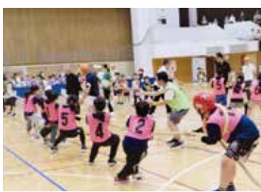
大声援の「つなひき大会」

また、6月22日(土)には、小豆沢体育館で5年ぶりに「つなひき大会」を開催しました。管内4つの小学校から計35チーム358名の参加があり、数多くの熱戦が繰り広げられました。スタンドには、保護者の方も多く来場し、アナウンスをかき消すほどの歓声が会場に響き渡りました。