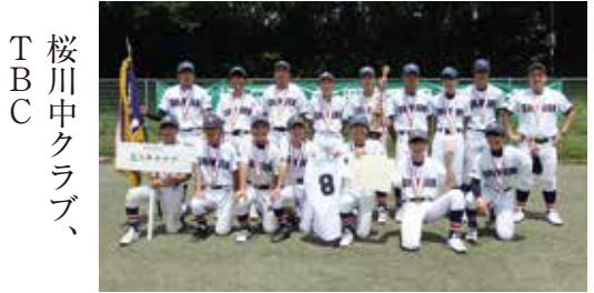
中学生の部優勝 志三中クラブ