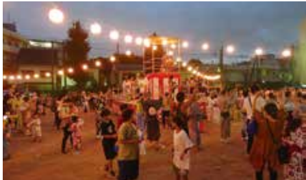
盆踊りではかつてない人出となった