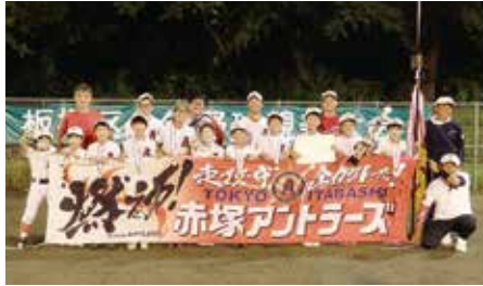
小学生の部優勝 赤塚アントラーズ