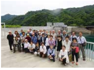
ハツ場ダムの前で集合写真