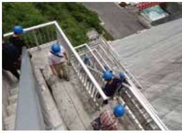
300段の外階段を下ります

津温泉に行く途中にあるダムといえはご存じの方も多いでしょう。ダムの建設に当たっては町を二分する議論が長きにわたり続き、時の政権による政策変更などに翻弄された歴史があります。