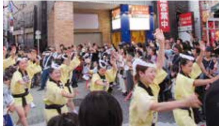
大勢の観客が見守る中、笑顔で踊り