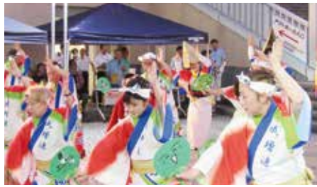
来賓の前での輪踊り熱演

昭和58年の地下鉄有楽町線の開通を機会に始まり、今年で38回目の開催となった。世代を超えた人々の地域活動への参加意欲の高さと住民同士の連帯感が感じられるこの大会は、地元成増地域から6連、「阿波おどり」で有名な高円寺から3連、渋谷区や文京区の間、板橋区役所の連も加わり、総勢13連、約500名が参加した。