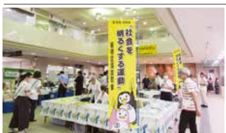
社明フェスタの様子

会場では、「社会を明るくする運動」「青少年健全育成地区活動」「更生保護活動」の紹介やPRのため、活動のよすのパネル展示、活動広報のDVD上映、更生保護マスコットキャラクター「ホゴちゃん」のぬり絵コーナー、刑務所作業製品の販売、夏野菜マルシェのコーナーが設置され、多くの区民で賑わった。