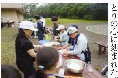
曇り空の下、カレー作りがスタート

初日、成増公園で出発式を行い、バス二台で向かった。初日、夜のゴーストバスツアーは楽しいけどお化けの