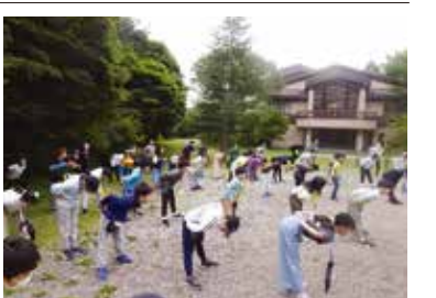
朝のふるさといたばし体操をする参加者

例年海の日の祝日を絡めた三連休に榛名林間学園で二泊三日の野外活動を実施している。