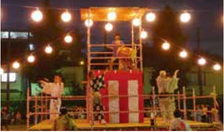
男性師範による優雅な踊り

昭和58年の地下鉄有楽町線の開通を機会に始まり、今年で38回目の開催となった。世代を超えた人々の地域活動への参加意欲の高さと住民同士の連帯感が感じられるこの大会は、地元成増地域から6連、「阿波おどり」で有名な高円寺から3連、渋谷区や文京区の間、板橋区役所の連も加わり、総勢13連、約500名が参加した。