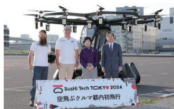
空飛ぶクルマの都内初飛行