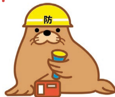
東京とどまるマンションPRキャラクター「トドまるくん」

東京とどまる マンションについて > 住宅政策本部マンション課 ☎ 03-5320-5007