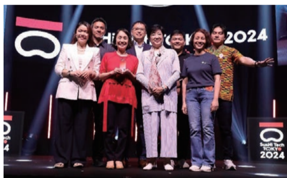
スタートアップ企業のピッチコンテスト [SusHi Tech Challenge]