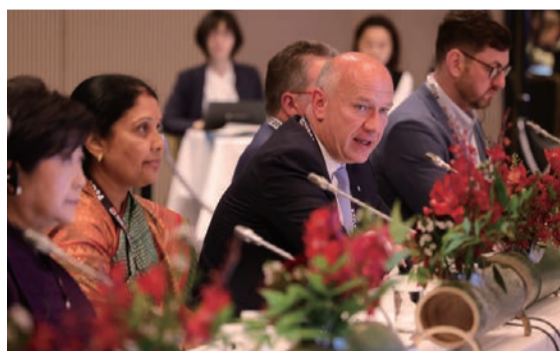
都市のリーダーが参加