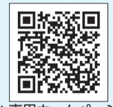
▲専用ホームページ