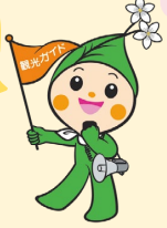
いたばし観光キャラクター りんりんちゃん