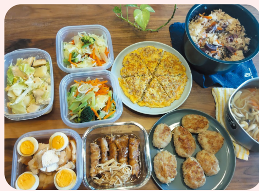
産後ドゥーラが調理した料理の一例